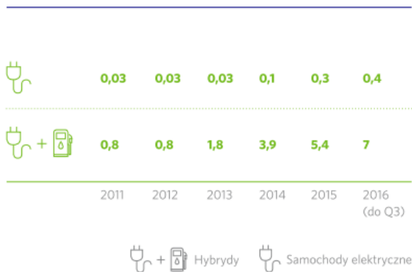
Rys. 1. Liczba nowych rejestracji Samochodów elektrycznych w Polsce (tys.), [4].

Wzrost liczby aut elektrycznych wywoła szereg skutków dla sektora energetycznego. Ministerstwo Energii szacuje, że milion pojazdów wygeneruje zapotrzebowanie na energię elektryczną wysokości ok. 2,3 - 4,3 TWh rocznie, co z jednej strony jest wyzwaniem dla Krajowego Systemu Energetycznego, ale z drugiej – szansą dla firm z branży. Resort szacuje, że przy dziesięcioletnim przeciętnym okresie eksploatacji samochodu, przychody firm energetycznych ze sprzedaży energii na ten cel mogą sięgnąć nawet 20 mld zł. Ministerstwo Energii podzieliło elektromobilności w Polsce na trzy etapy, rys. 2.